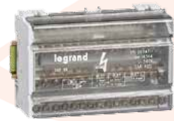
Bipolares 100 - 125 A